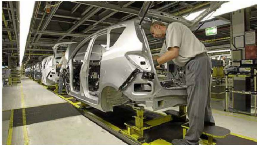
Cadena de montaje de la planta de Figueruelas de General Motors. GUILLERMO MESTRE

La calidad de los productos y servicios es una demanda creciente de los consumidores que los fabricantes y proveedores se esfuerzan en satisfacer para poder sobrevivir en un mercado cada vez más competitivo. La estadística ayuda a mejorar los procesos para aumentar la calidad y disminuir los costes, permitiendo incrementar tanto la satisfacción de los clientes como los beneficios de las empresas