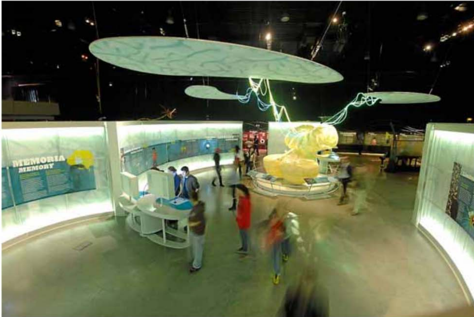
La exposición 'Cerebro. Viaje al interior' puede visitarse en el Parque de las Ciencias de Granada. PARQUE DE LAS CIENCIAS DE GRANADA

# 638 CIENCIA APLICADA | CREATIVIDAD | EMPRESAS | HERALDO DE ARAGÓN Martes 18 Jun. 2013